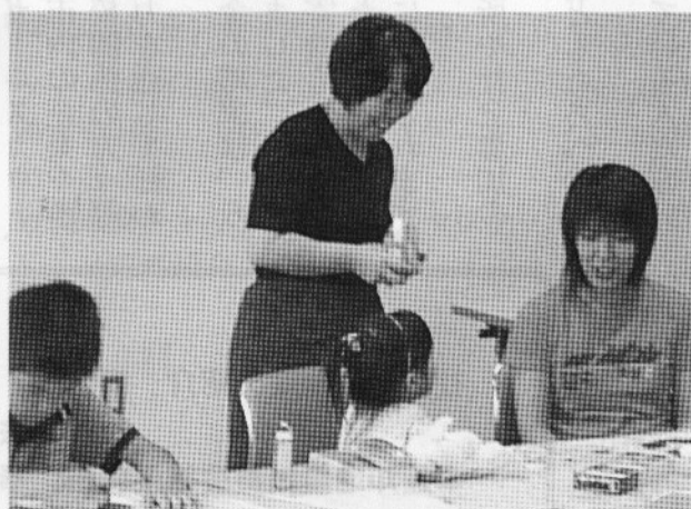
「親子ふれあい広場」の風景です。小さい子どもたちも、一所懸命でした。