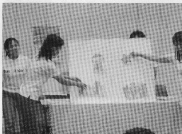
「親子おはなし会」の風景です。皆さん、熱心に聞き入っていました。