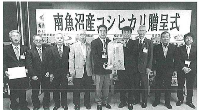
▲サロン、子ども食堂代表者が受領

いただいたコシヒカリは、生活困窮者支援(公的な相談窓口で自立相談をしている方)、ふれあいいきいきサロン、子ども食堂などで活用させていただきます。