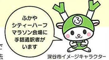
深谷市イメージキャラクター