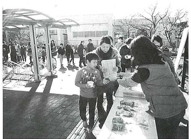
卵の配布会の様子

各家庭で約2か月間育てられたサケは、体長数センチの稚魚となり、2月17日(土)中瀬地内の利根川に放流します。