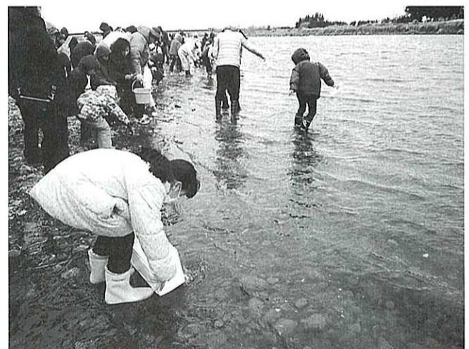
サケの稚魚放流会の様子 (H28年度)