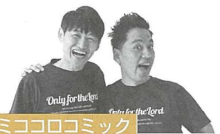
ミココロコミック