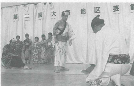
▲大寄地区有志の皆さんによる『ご存知 水戸黄門』のお芝居

また、今年初めて正伝空手道の小学生による演武があり、練習の成果を地元の皆様に見せたいと、頑張ってくれました。