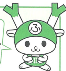
深谷市イメージキャラクター ふっからちゃん