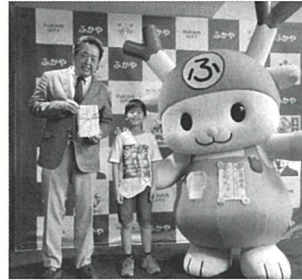
▲ふっかちゃん子ども福祉基金へ寄贈

(1,092.2キロ)、幡羅小学校(1,042.6キロ)、深谷中学校(1,013.5キロ)、明戸中学校(1,109.1キロ)、上柴中学校(1067.1キロ)、幡羅公民館(1075.9キロ)、川本総合支所(1025.3キロ)に感謝状を贈呈しました。今年度もペットボトルキャップの収集を行っておりますので、皆様のご協力をお願いします。