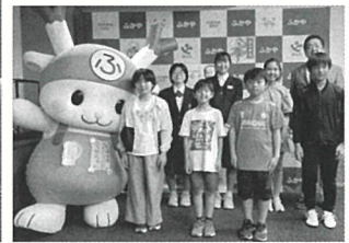
▲参加者全員で集合写真