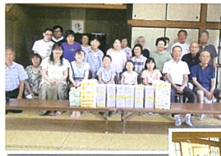
集合写真の前は賞品