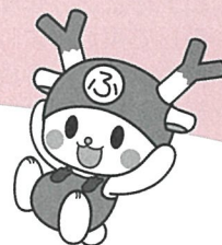
深谷市イメージキャラクター ふっかちゃん

◆毎年、国体の後に開催されている全国障害者スポーツ大会は、障害のある人もない人も、誰もがスポーツを通じて喜びや感動を分かち合い、障害に対する理解を深め障害者の社会参加の推進に寄与することを目的としています。